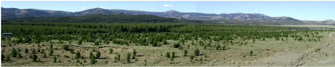
Figura 3. Invasión de P. contorta en el sector de Coyhaique Alto, Región de Aysén.

En el sur de Chile, fue introducida en la década del 70 con el fin de controlar la erosión de suelos. Hoy en día, se encuentra invadiendo en al menos dos localidades: la Reserva Nacional Malalcahuello (Región de la Araucanía), donde existen al menos 78 ha afectadas por la especie (Peña et al. 2008); y en los alrededores de Coyhaique (Región de Aysén) (Figura 3). En esta última zona, aunque no se conoce la superficie total afectada por la invasión de P. contorta , se encuentra invadiendo en numerosos sectores. Langdon et al. (2010) determinaron que en ecosistemas de praderas artificiales (dominadas por especies exóticas), P. contorta presenta menores densidades que en el ecosistema de estepa. En este último alcanza densidades de 13.000 individuos por hectárea. En ambos ecosistemas la densidad poblacional continúa en aumento, ya que la tasa de repoblación, aunque variable, es continua. Por otro lado, con base en patrones espaciales, Langdon et al. (no publicado) demostraron que existen interacciones positivas entre la regeneración de P. contorta y la especie nativa Baccharis magellanica . Estudios aún en desarrollo evalúan si la interacción influencia también el crecimiento de la especie o sólo favorece su establecimiento.