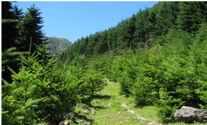
Figura 2. Invasión de P. menziesii en la Reserva Nacional Mañihuales, Región de Aysén.

Pseudotsuga menziesii ha sido reportada como invasora en Argentina, Chile, Austria, Bulgaria, España y Gran Bretaña. Esta especie, al ser tolerante a la sombra, no sólo ha sido reportada invadiendo en matorrales y praderas, sino que también es capaz de establecerse y crecer bajo una cobertura arbórea, convirtiéndose en una verdadera amenaza para el bosque nativo. En Chile se han realizado estudios tanto en áreas protegidas (Figura 2) (Teillier et al. 2003, Peña et al. 2004, Langdon et al. no publicado), como en áreas privadas (Pauchard et al. 2008). Estos estudios han determinado que esta especie se encuentra invadiendo ecosistemas chilenos, aunque de manera incipiente. Es fundamental continuar con el estudio del potencial invasor de esta especie, dados los impactos que podría generar sobre la biodiversidad nativa.