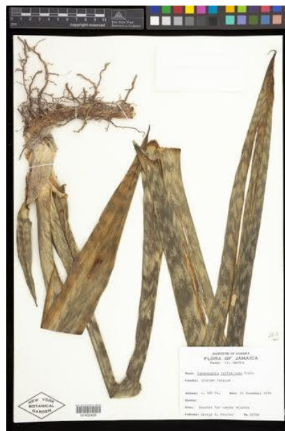
Figura 2. Sansevieria trifasciata

Nombres comunes: Alelo, Cañaño, Cuerda del arco africano, Cañaño cuerda, Chanvre d'Afrique, Kitelel, Konje cañaño, Langue de belle-mère, Lengua de Suegra, Lengua de la madre, Ngata, Riri, Sansevieria, Snakeplant, Tigre, Cuerda de cañaño de la víbora, Mapanare, Tiger cat, Oreillo di burian, Rhamni, Yerba ci cinta, Yerba di colebas (ISSG 2013, Hoyos 1999, Acevedo-Rodríguez & Strong 2012).