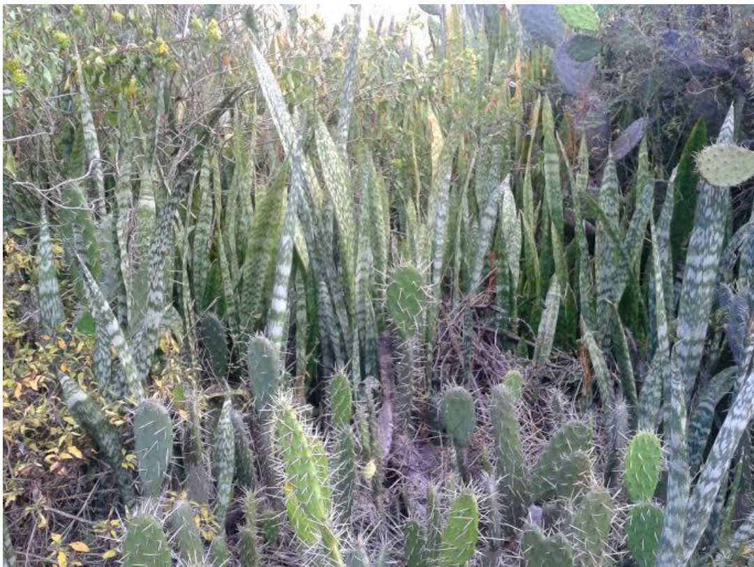
Figura 3. Colonia de plantas de S. trifasciata formando parte de la estructura del Matorral Xerófilo Espinoso (Foto Julio C. Romero-Briceño).

La rápida proliferación de esta especie a través de rizomas, sugiere realizar monitoreos consecutivos del área de expansión de esta especie e identificar si podría ser nociva para el ecosistema, al alterar las condiciones del suelo, el microclima, la composición de especies vegetales, entre otros posibles efectos, solo con esta información podremos determinar cuál es la prioridad para la toma de acciones contra esta especie en la cordillera de los Andes.