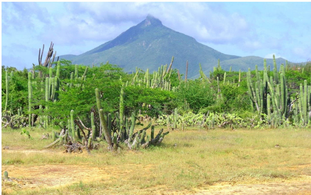
Figura 2. Arbustal espinoso del Monumento Natural Cerro Santa Ana.