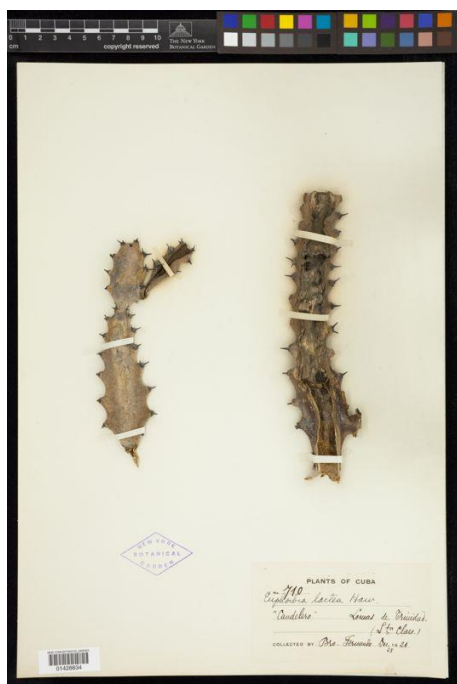
Figura 3. Euphorbia lactea.

Recientemente se le reporta como especie invasora en las islas Kauai y Oahu de Hawai (Frohlich 2012 citado por PIER 2011). Además ha logrado naturalizarse en Florida, Estados Unidos (USDA 2013). También Little et al. (1974) citado por PIER (2011) menciona la formación de algunos matorrales de esta especie en Puerto Rico. En Venezuela, E. lactea sólo ha sido registrada como una especie introducida y cultivada con fines ornamentales (Steinmann 2004; Hoyos 1998, 1990, 1985; Ojasti, et al. 2001).