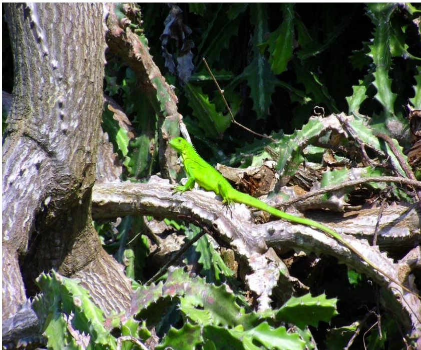
Figura 4. Individuos de E. lactea en el área de estudio e Iguana iguana posada sobre una de sus ramas.

Se sugiere realizar monitoreos consecutivos del área de expansión de esta especie e identificar si podría ser nociva para el ecosistema, al alterar las condiciones del suelo, el microclima, la composición de especies vegetales, entre otros posibles efectos, solo con esta información podremos determinar cuál es la prioridad para la toma de acciones contra esta especie en el monumento natural Cerro Santa Ana (Herrera y Nassar 2009).