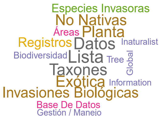
Figura 3. Nube de palabras indicando los términos normalizados más frecuentes en los artículos en los números especiales. El texto se extrajo de archivos PDF utilizando el Pquete de R rdftools (excluyendo las referencias), tokenizado y limpiado con tidytext, stringr y stopwprds, estandarizado conceptualmente antes del análisis de frecuencia utilizando dplyr. El tamaño de la palabra refleja la frecuencia relativa en el cuerpo. Palabras conectoras han sido descartadas. La palabra “invasiones” e “invasiones biológicas” se consideraron sinónimos. La visualización se realizó con el paquete wordcloud en R.

Todos los autores: conceptualización, metodología, escritura-revisión y edición; JR UW: escritura – borrador original; JR UW, KF, AP: Visualización