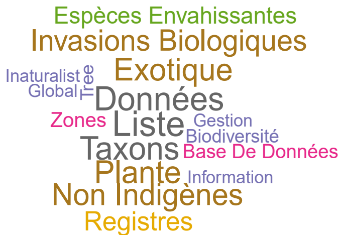
Figure 3. Nuage de mots montrant les termes normalisés les plus fréquents dans l'ensemble des articles des numéros spéciaux des revues. Le texte a été extrait des fichiers PDF à l'aide du package R pdftools (références exclues), tokenisé et nettoyé avec tidytext, stringr et stopwords, puis standardisé conceptuellement avant l'analyse de fréquence à l'aide de dplyr. La taille des mots reflète leur fréquence relative dans le corpus. Les mots de liaison ont été supprimés. Les termes « invasions » et « invasions biologiques » ont été considérés comme synonymes. La visualisation a été produite avec le package wordcloud dans R.