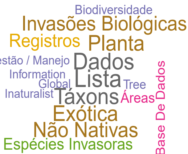
Figura 3. Nuvem de palavras mostrando os termos normalizados mais frequentes nos artigos das edições especiais. Os termos foram extraídos dos arquivos PDF usando o pacote pdftools do R (referências excluídas), tokenizados e limpos com tidytext, stringr e stopwords, depois padronizados conceitualmente antes da análise de frequências usando dplyr. O tamanho das palavras reflete a frequência relativa no corpus. Palavras de conexão foram descartadas. As palavras “invasões” e “invasões biológicas” foram consideradas sinônimos. A visualização foi produzida com o pacote wordcloud no R.